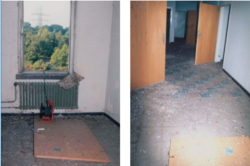
Abbildungen: 3 a,b. Taubenkotkontamination, die gut absaugbar ist

Die Reinigung dieser Arbeitsbereiche sollte daher nicht unter Verwendung von Schaufeln und Besen, Hochdruckreinigern oder durch Abbürsten (s. Abbildung 2) geschehen, da Mikroorganismen bei den beschriebenen Tätigkeiten zusammen mit Staub- oder Flüssigkeitspartikeln verstärkt in die Luft freigesetzt werden.