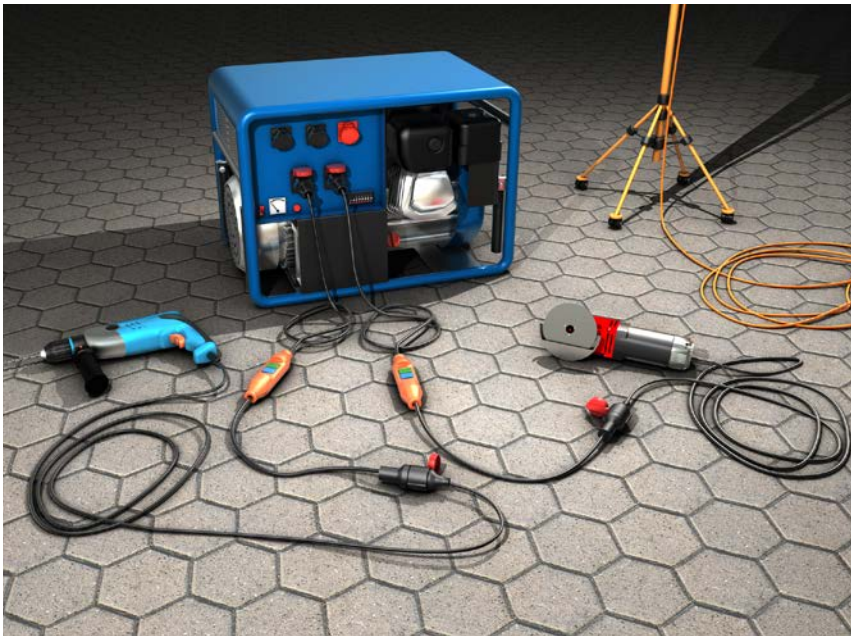
Abb. 5 Betrieb sämtlicher Betriebsmittel über jeweils eine PRCD

Der Einsatz eines Trenntrafos anstelle eines RCD ist immer möglich, zulässig und sicher.