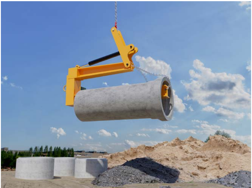
Abb. 3 C-Haken