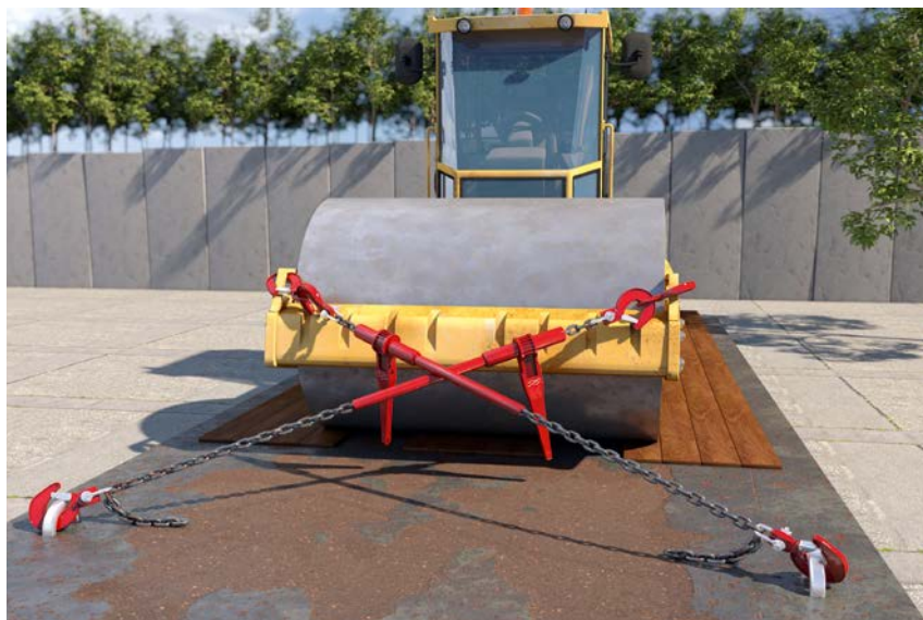
Abb. 11 Mittels Diagonalzug gesichertem Walzenzug