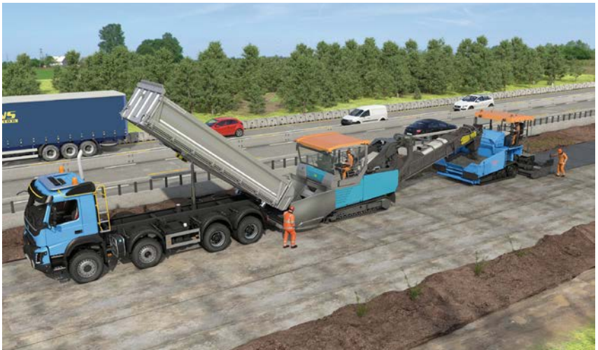
Abb. 18 Asphaltbau mit Beschicker

Weitergehende Informationen finden sich im Kapitel 3.6 „Gefährdung bei Arbeiten mit Gefahrstoffen“.