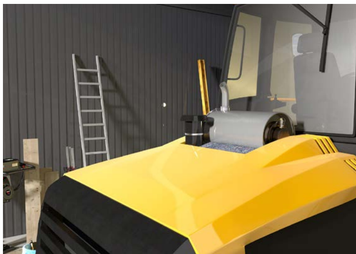
Abb. 9 Nachrüstung eines Dieselpartikelfilters

Siehe auch Anhang 1 Nummer 3 TRGS 554 „Abgase von Dieselmotoren“.