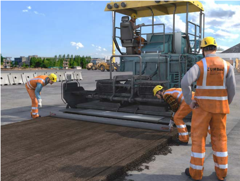
Abb. 8 Beispiel für die Prüfung zum „Geprüften Fahrer von Straßenfertigern“ nach ZUMBau-Standard