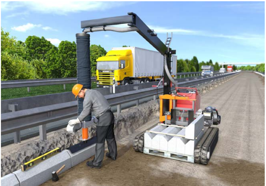
Abb. 7 Bordsteinversetzgerät