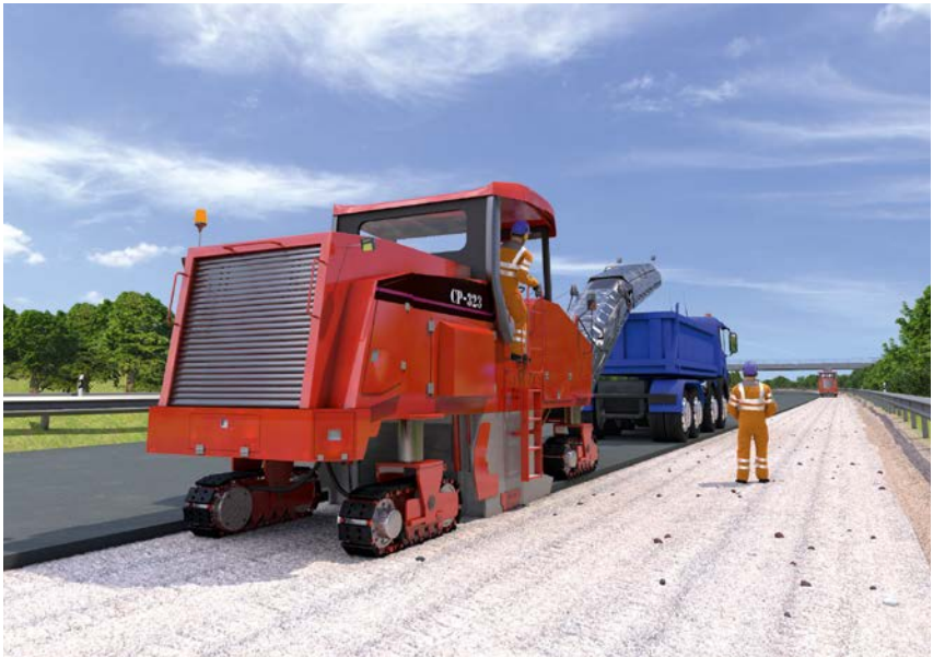
Abb. 16 Straßenfräse