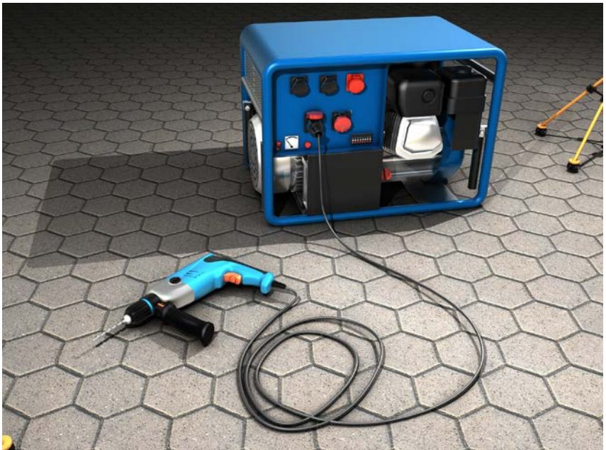
Abb. 4 Ein einzelne Betriebsmittel direkt am Stromerzeuger angeschlossen