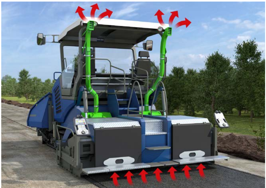
Abb. 17 Absaugung an einem Straßenfertiger