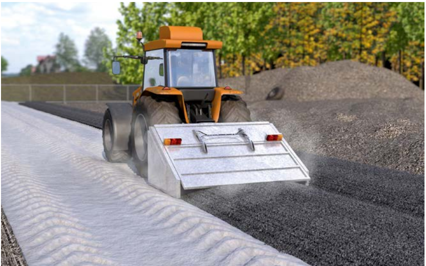
Abb. 14 Bodenstabilisierung