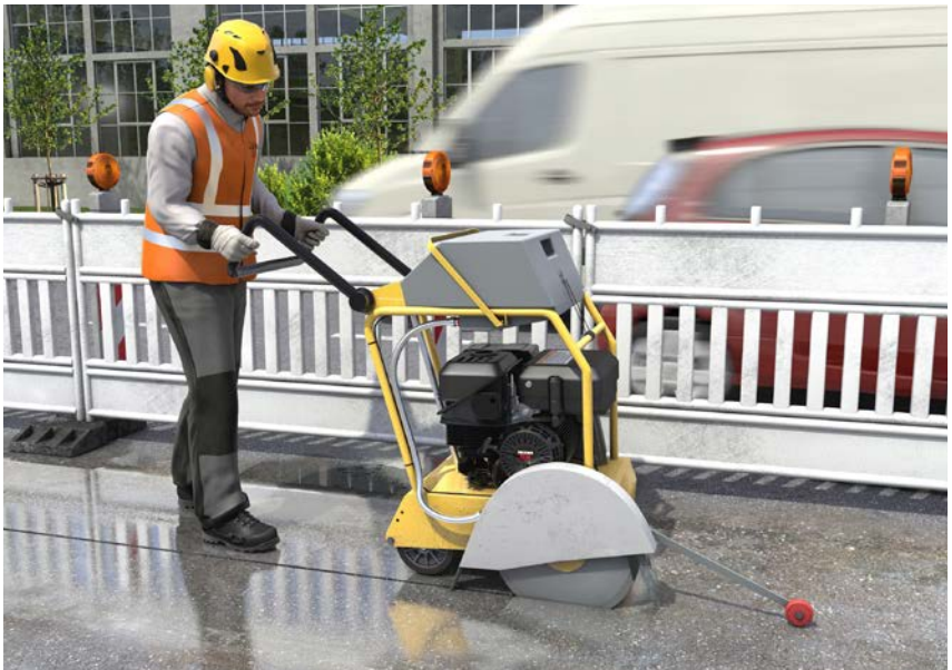
Abb. 15 Staubminimierung durch Nassschneiden

5.7.2 Fugenschneider dürfen nur mit geeigneten (Herstellerangaben) und unbeschädigten Schneidscheiben verwendet werden.