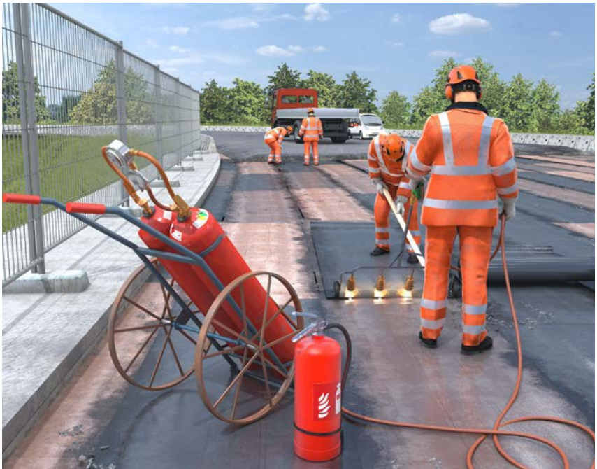
Abb. 6 Arbeiten mit Handbrennern

Brand- und Explosionsgefahr besteht z. B. bei der Verwendung von brennbaren Stoffen, beim Umgang mit Flüssiggas oder bei Arbeiten in der Nähe von Gasleitungen.