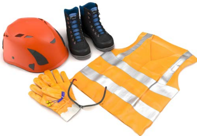
Abb.1 Auswahl an PSA

Das Tragen von Warnkleidung wird für alle Bauarbeiten empfohlen, bei denen mobile Arbeitsmittel (insbesondere Bagger, Radlader, LKW) eingesetzt werden.