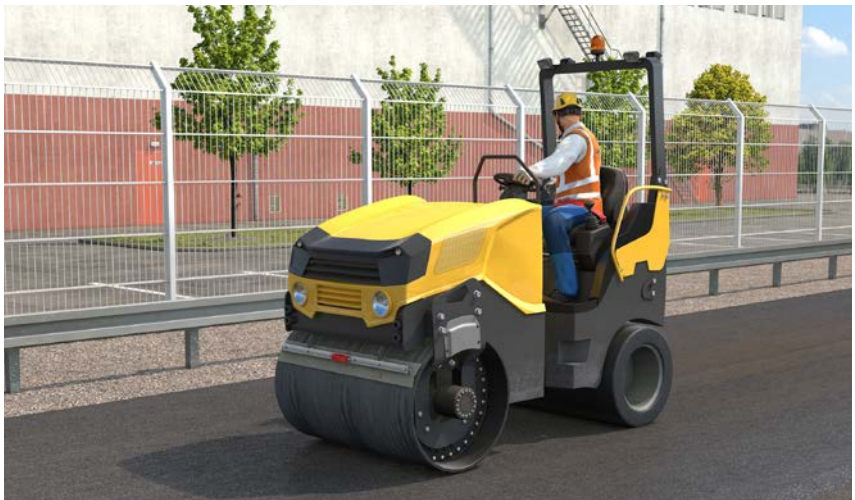
Abb. 12 Überrollschutzeinrichtung und Sicherheitsgurt bieten Schutz bei Umsturz

Werden Straßenwalzen mit klappbarem Überrollschutz eingesetzt, muss dieser aufgeklappt und arretiert sein. Zusätzlich muss der Haltegurt angelegt sein.