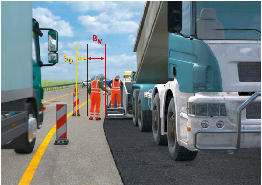
Abb. 19 Sicherheitsabstände

Bei Arbeiten im Grenzbereich zum fließenden Straßenverkehr ist der erforderliche Platzbedarf für Arbeitsplätze, Verkehrswege, Sicherheitsabstände und technische Schutzeinrichtungen auf Grundlage der Technische Regel für Arbeitsstätten (ASR) A5.2 „Anforderungen an Arbeitsplätze und Verkehrswege auf Baustellen im Grenzbereich zum Straßenverkehr – Straßenbaustellen“ festzulegen. Können die Mindestmaße aus der ASR A5.2 nicht eingehalten werden, sind als Ergebnis einer Gefährdungsbeurteilung Schutzmaßnahmen festzulegen, die mindestens die gleiche Sicherheit und den gleichen Gesundheitsschutz für die Beschäftigten erreichen.