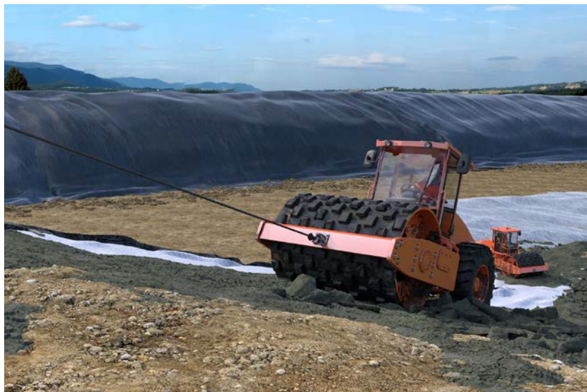
Abb. 10 Einsatz auf Böschung