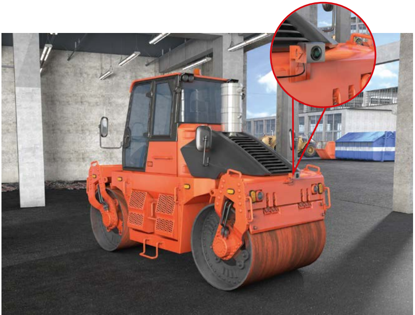
Abb. 2 Sichteinschränkung durch nachgerüsteten PDF DPF wird durch technisches Hilfsmittel ausgleichten, hier durch Kamera-Monitor-System

Siehe auch § 7 DGUV Vorschrift 38 „Bauarbeiten“.